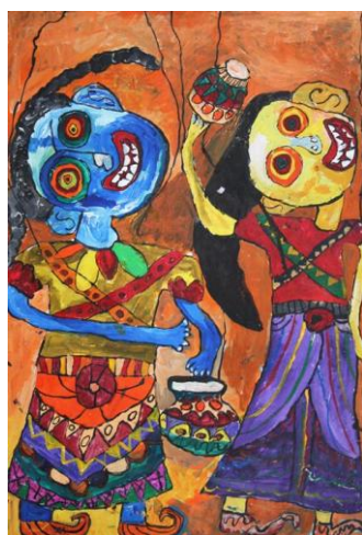
Kamburugamuwe Upunya, 7 let, Sri Lanka

Děti pod vedením pedagogů, ztvárňovaly mnohé ze zapsaných dědictví své země - tradiční řemesla, obřady, zvyky i lidovou tvořivost svých zemí, z nichž mnohé jsou i v zemích svého původu záležitostí kraje a ojedinělou, hodnou uchování pro další generace. Mezi nejčastější náměty prací českých dětí patřilo masopustní veselí, moravské tance, lidové kroje a tradiční řemesla.