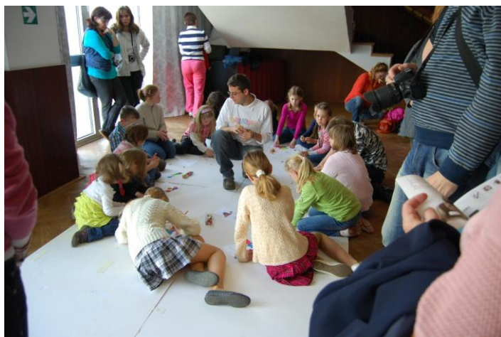
Игры с пластилином организованные венесуэльским художником

Отдельная благодарность выражается Комитету Фестиваля Чехословацкого сообщества в г. Филлипс, штат Висконсин, США , который предоставил значительные финансовые средства на призы для детей. Интересно добавить, что именно в г. Филлипс, Висконсин находится один из двух памятников трагедии Лидице в США (второй располагается в городе Сидар-Рapidс, Чикаго), который был построен летом 1943 г. на пожертвования комитета фестиваля чехословацкого сообщества в г. Филлипс.