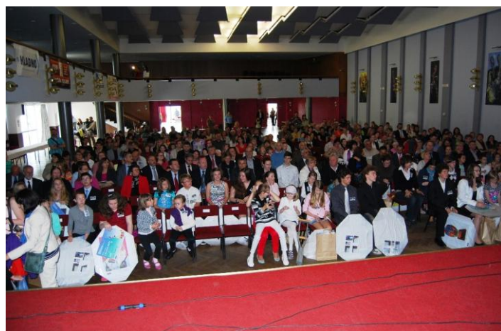
Зал культурного дома Кладно был полон