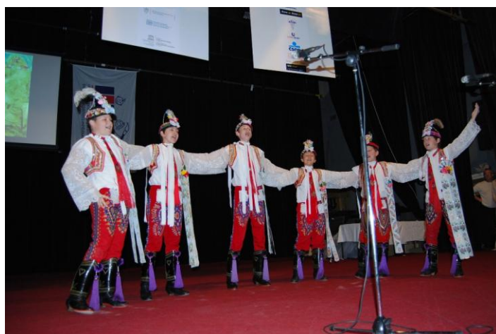
Выступление ансамбля Кордулка – танец вербунк