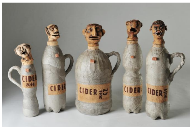
Совместная работа детей, 11-15 лет, начальная худ. школа В. Амбросе, Простейов

Приз жюри , который присуждается школам за постоянную, целенаправленную и отличную работу получила в этом году за Чешскую Республику начальная художественная школа Владимира Амбросе, Простейов , которая представила богатую и интересную коллекцию пространственных и плоских работ. Приз жюри для заграничной школы жюри присудило Фотостудии МИГ при Муниципальном Дворце детей и молодежи Креатив, Донецк, Украина за исключительную коллекцию фотографий.