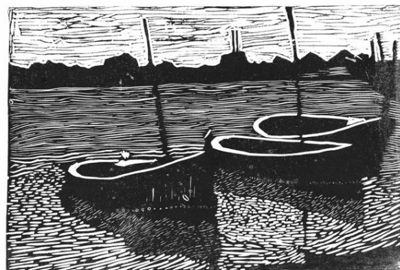
Bartłomiej Harnasz, 14 Jahre, MDK pracownia plastyczna „Creatio“, Rybnik, Polen