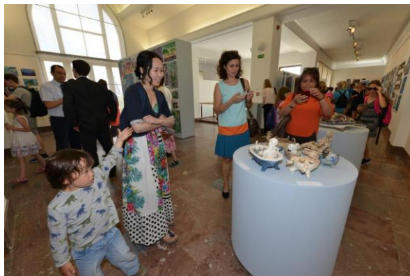
Z expozice MDVV v Lidické galerii