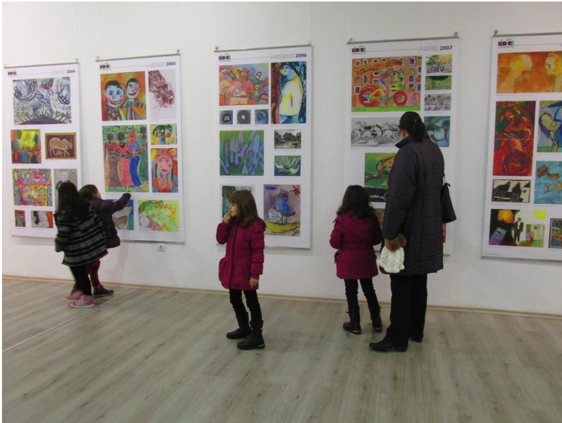
Art Center, Pleven, Bulharsko, listopad 2015