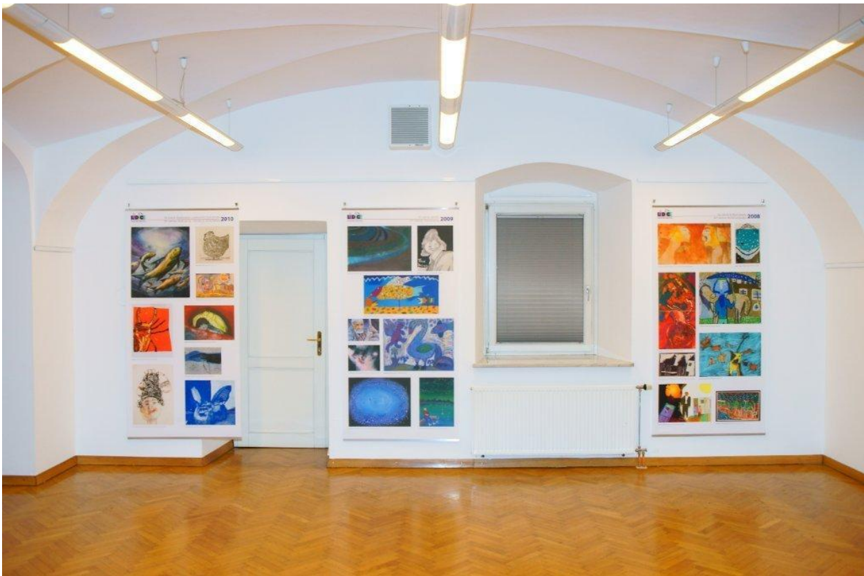
Galerie Družina, Lublaň, Slovinsko, prosinec 2012